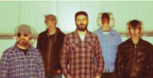
Miss Palencia, Unairen proiektu berria.