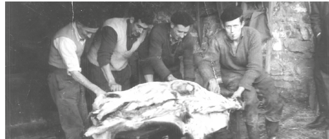
Muruako herritarrak baserriko txerri-hilketa batean.

Denbora luzean zehar, Zigoitiko herriak Gasteizeko hiltegirako iratze-hornitzaile nagusiak izan ziren. Eta joan den mendearan hasieran pasadizo bitxi bat gertatu zen. Iraitetik urtarrilera arte Gorbeia zonaldeko zigoitiarrak iratze orga asko jaisten zituzten hiltegira, garai horretan Gasteizko Alde Zaharreko Korreria kalean zegoena, hain zuzen ere. Pezeta batzuk ateratzeko modu bat zen, hil baino lehen txerriei ileak erretzeko behar ziren eta.