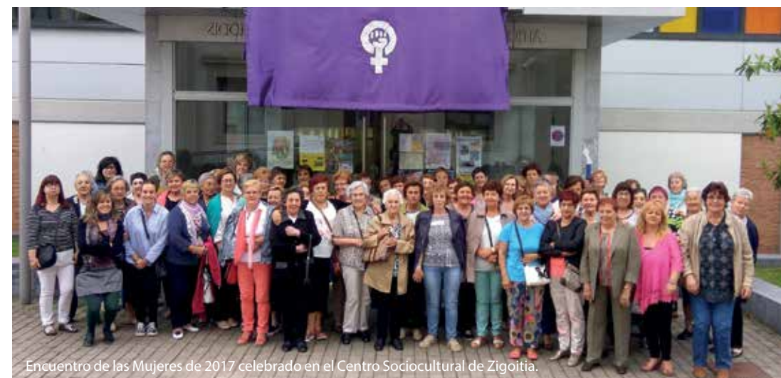
Encuentro de las Mujeres de 2017 celebrado en el Centro Sociocultural de Zigoitia.

+ info: ¿quieres recibir información sobre Igualdad? Actividades, talleres, charlas... ponte en contacto con nosotras en el email berdintasuna@gorbeialdea.eus